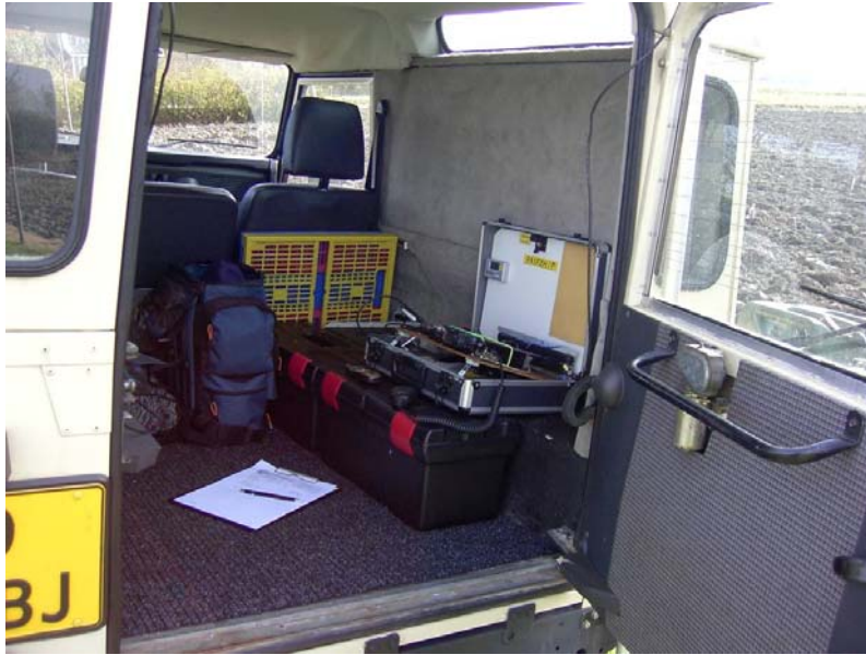
De nieuwe FZH-VC waarvan we de binnenzijde bekijken, binnenkort is deze geheel ingericht