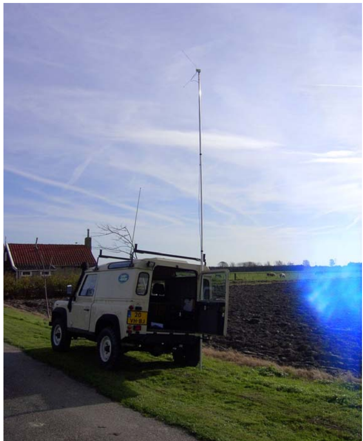
De locatie van Dan PA1FZH en zijn FZH-VC was bij boer Dekker in Lewedorp