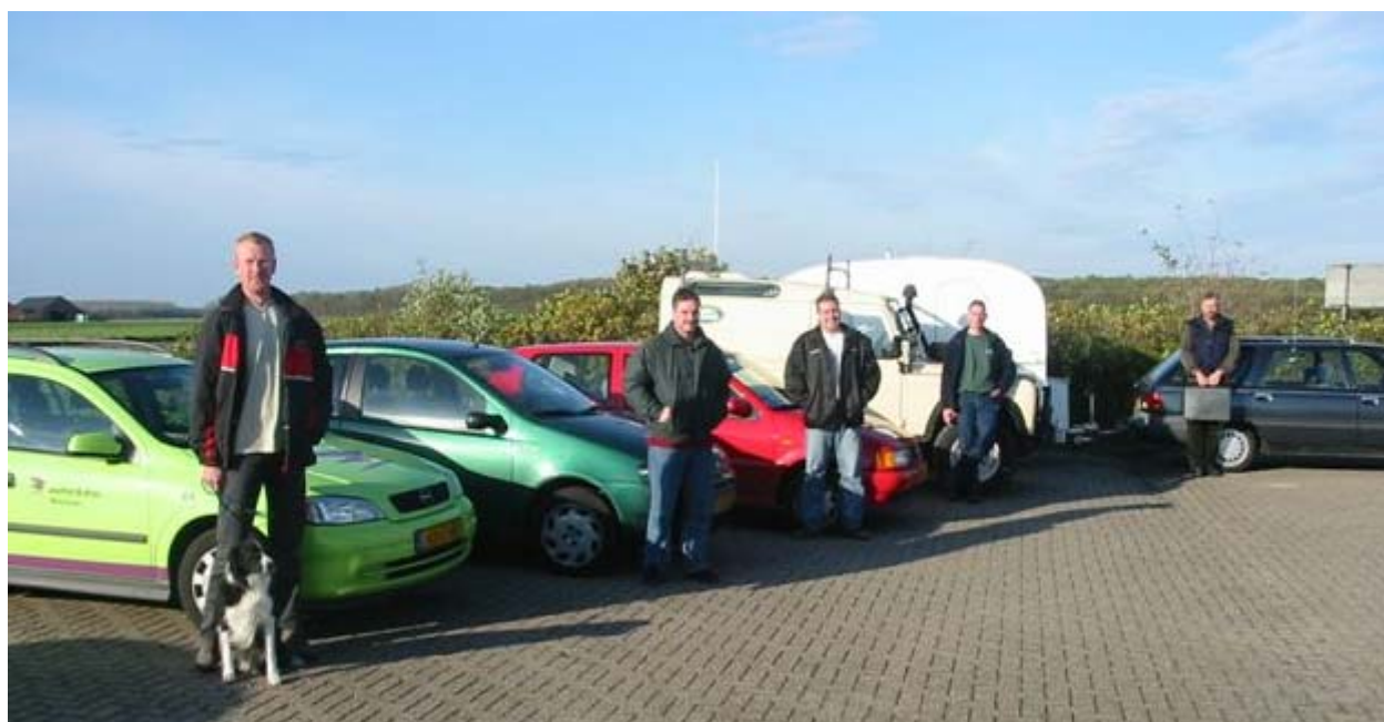
De deelnemende amateurs met hun mobiele voertuigen en aanvullend materieel