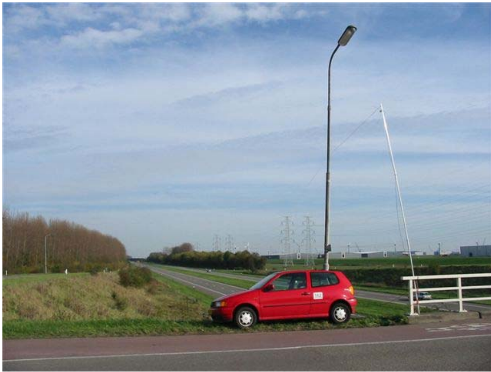
De locatie van Michel PD4AVO en zijn AVO-VC was het viaduct Engelandweg / N-254 Sloehaven